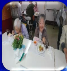
写真掲載に際し、本人の承諾を得ております。無断転用禁止

高砂荘厨房職員お手製の「シフォンケーキ」を提供させて頂きました。ほうれん草をはじめとする季節の野菜を練りこんだケーキはいかがだったでしょうか？有意義な時間を過ごせたと思います。次回も皆様のご参加をお待ちしております。